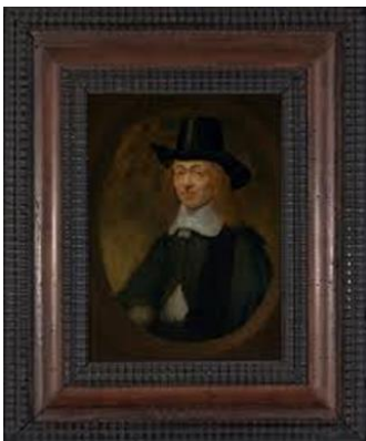
Nicolaes Maes, Constantijn Huygens, ca. 1658-1661. Olieverf op paneel. Particuliere collectie.

Van weinig Nederlanders zijn zoveel portretten vervaardigd als van Constantijn Huygens. We kennen maar liefst 35 portretten. Aan dit aantal kon er in 2023 een worden toegevoegd: een schilderij (ca. 1658) door Nicolaes Maes. Een focus-tentoonstelling op de 1 ste verdieping van Hofwijck presenteerde de verschillende levensfasen van Constantijn Huygens aan de hand van een aantal portretten in verf en prent. Het is bijzonder dat zo'n onbekend portret opduikt. Nicolaes Maes (1634-1693), vooral bekend als schilder van genrestukken, schilderde het aan het begin van zijn carrière.