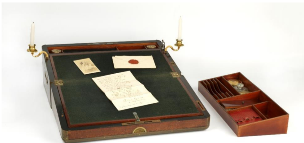
Reissecretaire van prinses Marianne

Prinses Marianne. Doorlopende presentatie in het Notarishuis. Eén van de zalen is permanent gewijd aan de eigenzinnige prinses Marianne. Deze opstelling loopt tot en met april 2024 – daarna wordt de zaal tijdelijk gesloten en de presentatie herzien. Na december 2024 komt de Mariannekamer weer terug, in een nieuw, feestelijk jasje.