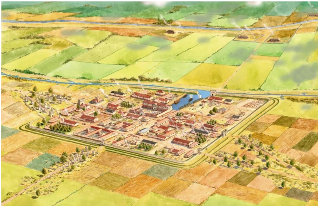
B. Brobbel, impressie van Forum Hadriani

Romeinen aan de Vliet. Doorlopende presentatie in het Notarishuis. Het unieke archeologische erfgoed van de Gemeente is permanent te zien in het Notarishuis. Forum Hadriani is van wereldklasse en de Limes erkend als UNESCO-werelderfgoed. Deze opstelling loopt tot en met april 2024 – daarna wordt de presentatie verplaatst naar de benedenzaal van het Notarishuis, waar er nog meer aandacht en ruimte is voor de Romeinen.