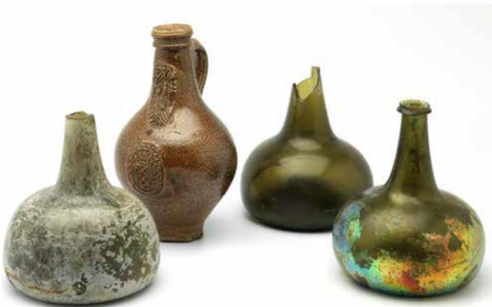
Een selectie flessen uit Hofwijck, bodemvondsten uit de eigen gracht.